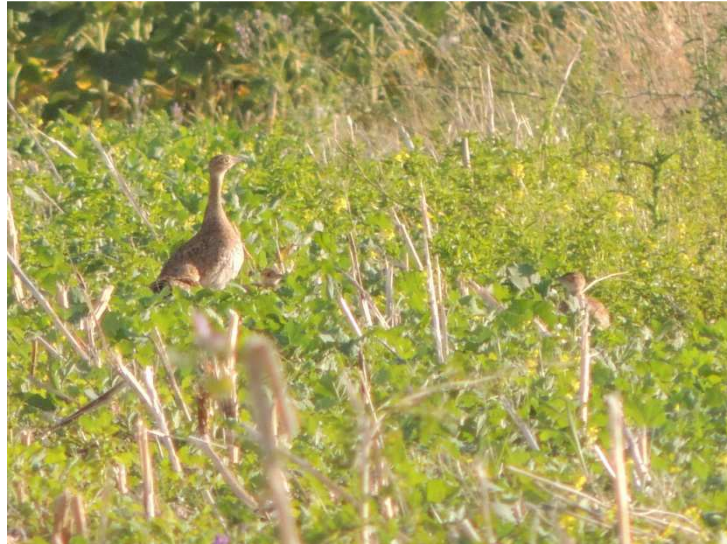
Figure 1: famille outarde st Martin de B.