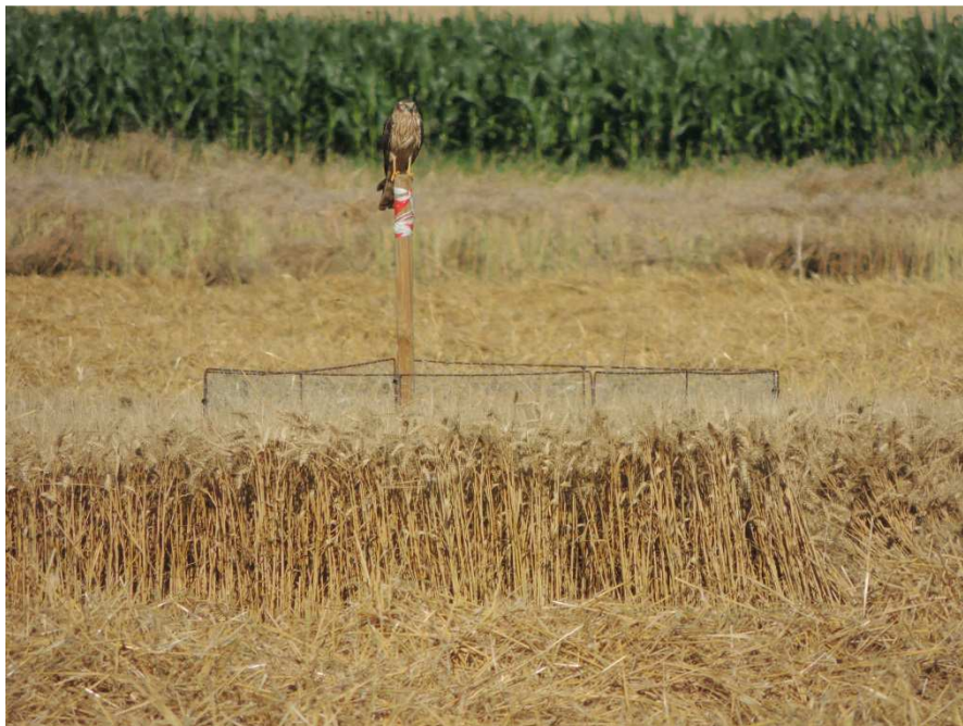
Figure 2 : nid Busard Cendré protégé 2014.